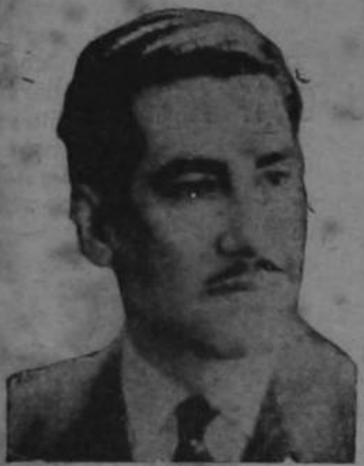
Dr. Arnulfo Arias

LOS SRES. PRESIDENTES DE PANAMA Y COSTA RICA, DOCTORES ARIAS Y CALDERON, RESPECTIVAMENTE, SE HAN APUNTADO UN TRIUNFO QUE LOS CONSAGRA EN LAS PAGINAS DE LA HISTORIA CON LETRAS DE ORO