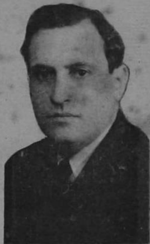
Dr. Rafael A. Calderón G.

tes. Costa Rica alcanzó muchos kilómetros más hacia el sur, en los días de la Colonia; el presidente Carrillo, hace cien años justos —según ya apuntó el periodista e historiador don Francisco María Núñez— trató de solucionar el problema de límites, aprovechando la separación